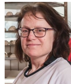
Gabriele Schmid Büro

„Ich arbeite gerne hier, weil man mir vertraut und ich nicht als Nummer, sondern als Mensch gesehen werde. Ich mag die Teamarbeit, die Abwechslung und dass alles wichtig ist für das Ganze. Nach so vielen Jahren ist die Bäckerei Pfeifle für mich wie eine zweite Heimat.“